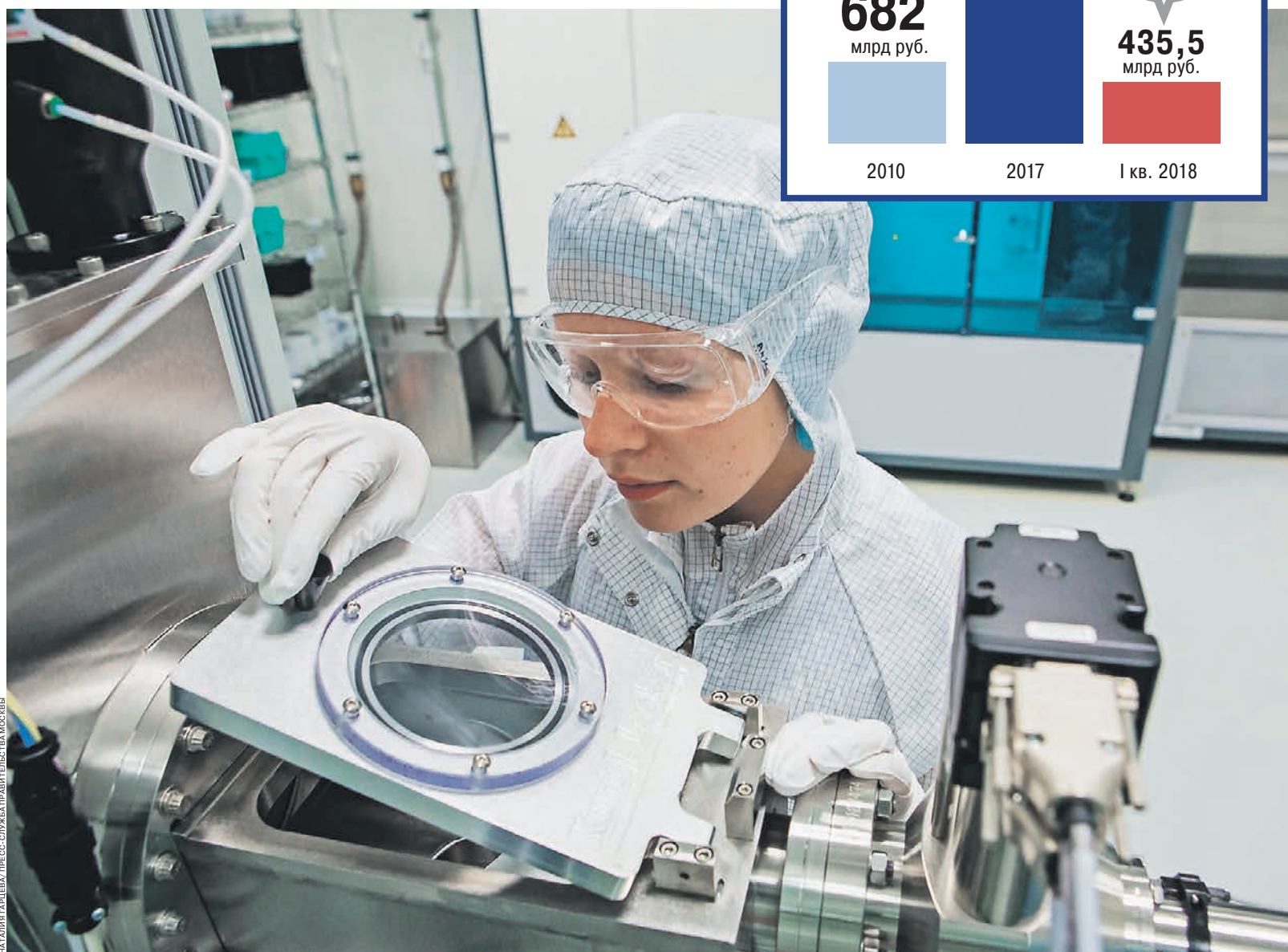
В столице порядка 850 тыс. малых и средних предприятий, что составляет более 13% от их общего количества в России

В каждом округе Москвы работают центры услуг для бизнеса ГБУ «Малый бизнес Москвы». Они предоставляют различные онлайн-сервисы, проводят профильное обучение и дают всю необходимую информацию. К примеру, на сайте учреждения можно подать заявку в