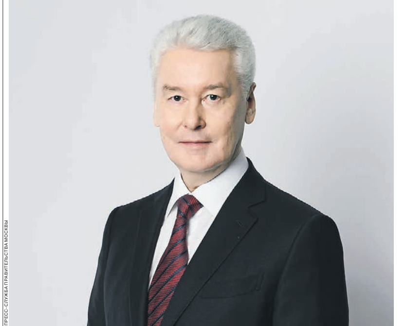
Сергей Собянин, мэр Москвы

Мероприятие такого масштаба проводится в Москве впервые. И это большой шаг к очень важной цели — формированию в столице комфортной среды для развития малого и среднего бизнеса. Московская неделя предпринимательства задумана как эффективная площадка для обмена опытом, это форум для бизнеса и о бизнесе. Здесь начинающие свое дело могут получить исчерпывающую информацию об этапах создания компании и сделать первые шаги на этом пути. А состоявшиеся предприниматели получат возможность найти новые идеи и ниши для развития своего бизнеса.