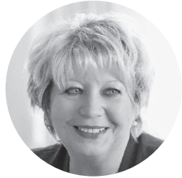
Мария-Кристина Оглы Президент Всемирной Ассоциации женщин предпринимателей FCEM